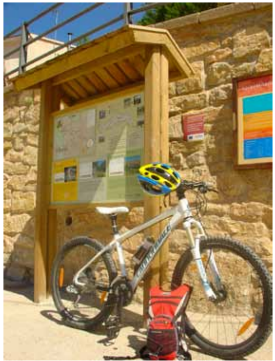
Panel informativo en Allepuz

Tras cruzar el lavadero, enlace con calle cementada y más adelante con la carretera A-226. A la izquierda se alcanza finalmente el punto de inicio de ruta, junto al panel informativo en Allepuz.