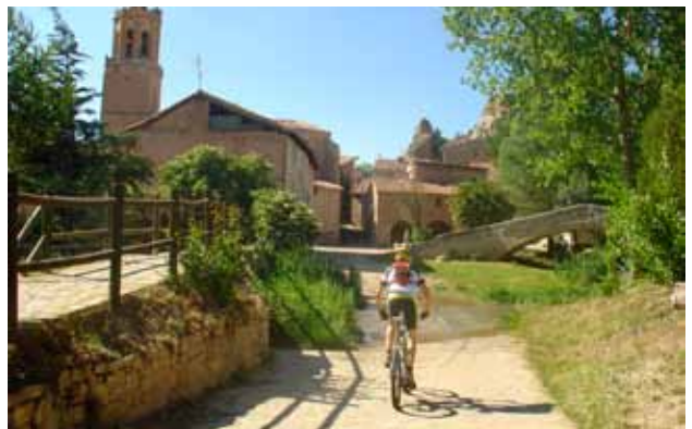
Miravete de la Sierra

Se alcanza la máxima altitud de la ruta BTT: 1.704 m. Abandono de la pista y comienzo de la Senda Balsaín. Seguir las indicaciones hasta tomar un sendero bien definido, en fuerte descenso entre el pinar.