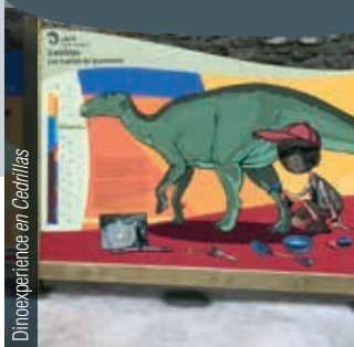
Dinoexperience en Cedrillas

paleontológicos para visitar en esta ruta