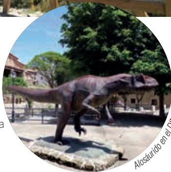
Alosaurido en el DINOpaseo

El Castellar está enclavado en un impresionante entorno natural de la Comarca de Gúdar-Javalambre. Se puede disfrutar del DINOpaseo (un recorrido de un kilómetro a pie por las calles del pueblo, donde se muestra la diversidad paleontológica del municipio a través de réplicas y esculturas, que finaliza en la denominada Alberca del Saurio ).