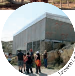
Yacimiento Las Cerradicas

Galve es un municipio de gran tradición e importancia paleontológica desde hace décadas. En el denominado Parque Paleontológico son visitables los yacimientos de icnitas de dinosaurios Las Cerradicas (junto a la carretera de acceso al pueblo) y Los Corrales del Pelejón (tras recorrer 4,5 km por pista de tierra), así como algunas reconstrucciones de los “lagartos terribles” en la chopera del río Alfambra.