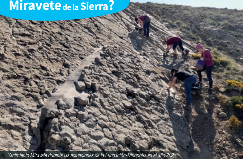
Yacimiento Miravete durante las actuaciones de la Fundación-Dinópolis en el año 2022.

El yacimiento Miravete se encuentra próximo al núcleo poblacional y se accede a él a través de una senda de 300 m con dificultad moderada. El entorno geológico de este yacimiento es representativo del Parque Cultural del Maestrazgo-Geoparque Mundial de la UNESCO .