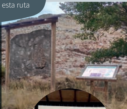
Réplica con icnitas en Aguilar del Alfambra