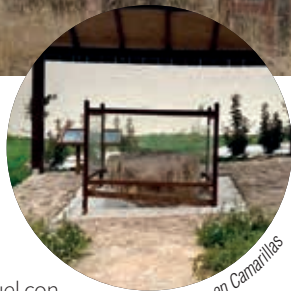
Icnitas en Camarillas

Huellas originales son exhibidas en Camarillas y una réplica que muestra algunas de las huellas de dinosaurios que han sido descritas en Aguilar del Alfambra se sitúa en la pista de tierra que lleva desde el pueblo hasta el río Alfambra.