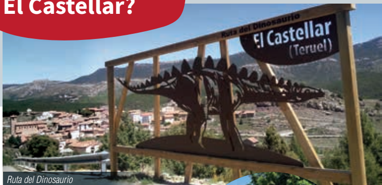
Ruta del Dinosaurio

El Castellar está enclavado en un impresionante entorno natural de la Comarca de Gúdar-Javalambre. Se puede disfrutar del DINOpaseo (un recorrido de un kilómetro a pie por las calles del pueblo, donde se muestra la diversidad paleontológica del municipio a través de réplicas y esculturas, que finaliza en la denominada Alberca del Saurio ).