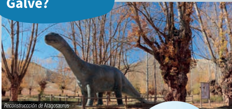
Reconstrucción de Aragosaurus

Galve es un municipio de gran tradición e importancia paleontológica desde hace décadas. En el denominado Parque Paleontológico son visitables los yacimientos de icnitas de dinosaurios Las Cerradicas (junto a la carretera de acceso al pueblo) y Los Corrales del Pelejón (tras recorrer 4,5 km por pista de tierra), así como algunas reconstrucciones de los “lagartos terribles” en la chopera del río Alfambra.