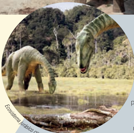
Ecosistema jurásico con saurópodos

El recorrido discurre especialmente por un entorno geológico de los periodos Jurásico y Cretácico, por lo que los fósiles de la ruta permiten reconstruir algunas escenas del pasado como, por ejemplo, a diversos dinosaurios carnívoros acechando a manadas de saurópodos – cuadrúpedos con cuello y cola largos–, estegosáuridos –con placas dérmicas desde el cuello hasta el final de la cola– y ornitópodos.