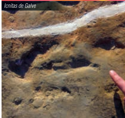
Icnitas de Galve

También, en la sede de Dinópolis “ Legendark ” y en el Museo Paleontológico de Galve se exhiben fósiles originales y reconstrucciones de algunos de los dinosaurios que han sido descubiertos en el municipio.