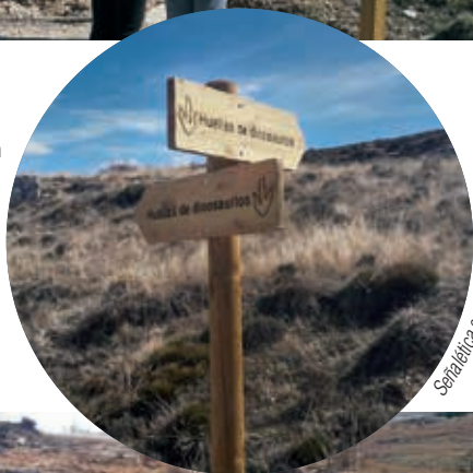
Señalética en Ababuj

El yacimiento Ababuj se sitúa en los márgenes de la carretera que lleva desde el pueblo hasta Aguilar del Alfambra.