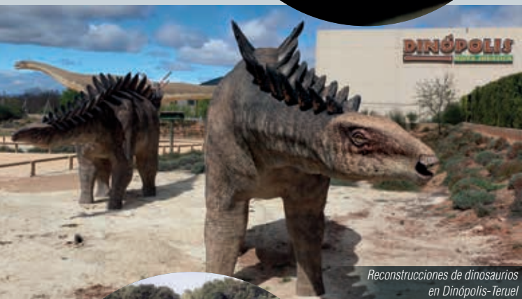
Reconstrucciones de dinosaurios en Dinópolis-Teruel