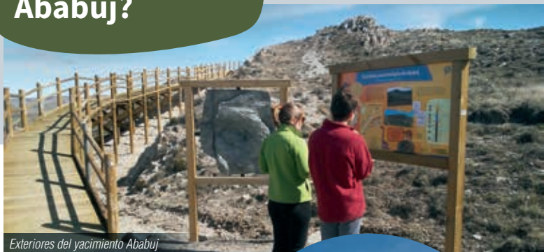
Exteriores del yacimiento Ababuj

El yacimiento Ababuj se sitúa en los márgenes de la carretera que lleva desde el pueblo hasta Aguilar del Alfambra.