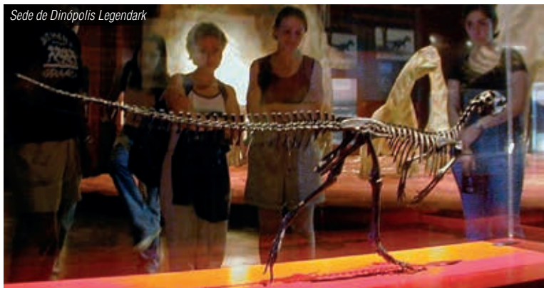
Sede de Dinópolis Legendark