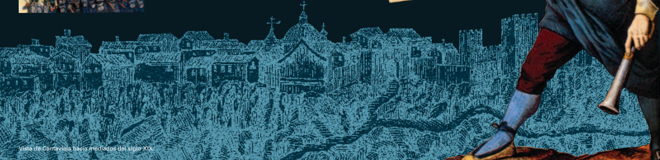
Vista de Cantavieja hacia mediados del siglo XIX.