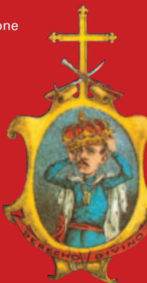
Detalle de la Alegoría del Absolutismo. La Flaca, 1872.

El Museo de las Guerras Carlistas de Cantavieja propone un viaje en el tiempo para descubrir aquellas montañas que en el siglo XIX saltaron a la primera plana de la actualidad como reducto de la insurgencia carlista.